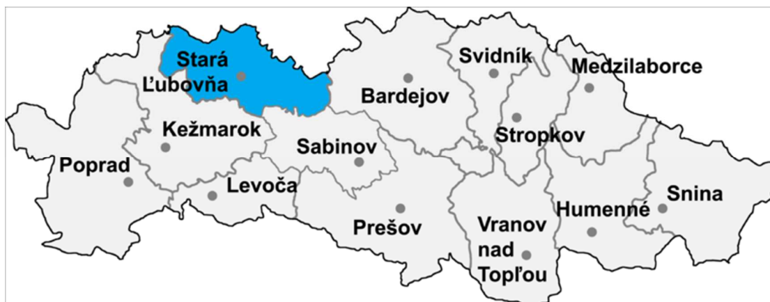
Umiestnenie okresu Stará Ľubovňa v rámci Prešovského kraja (zdroj: sk.wikipedia.org)

Cesty II. triedy: 20,787 km Cesty III. triedy: 138,639 km (zdroj: sk.wikipedia.org)