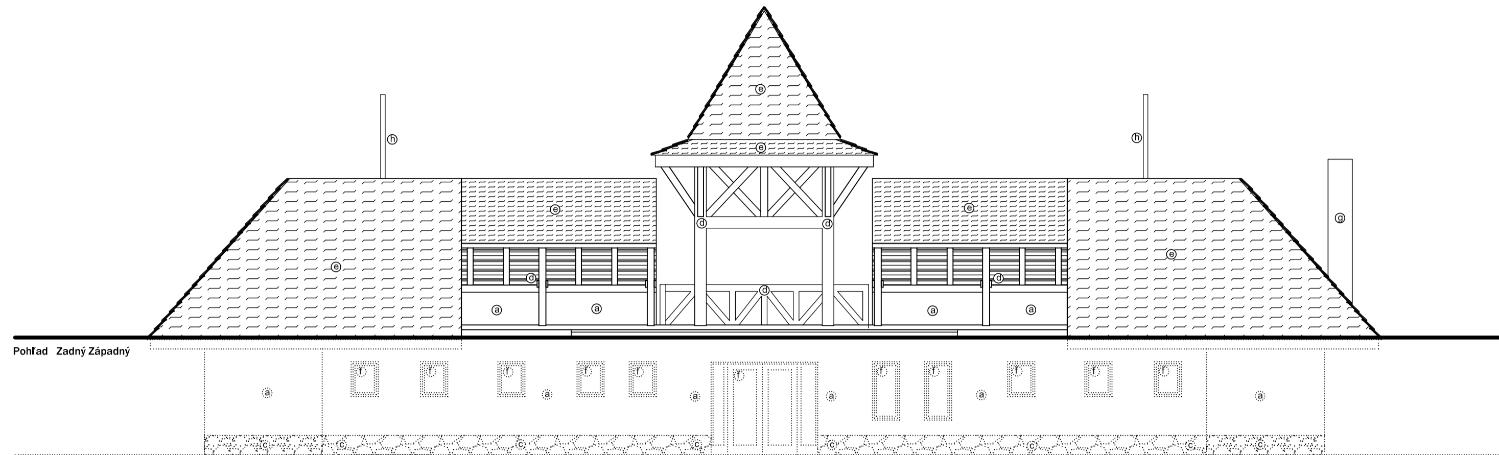
Pohľad Zadný Západný